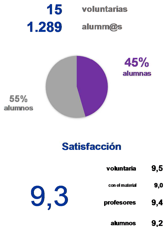
Número de alumn@s por curso